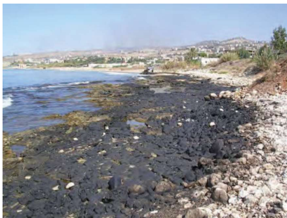
Côte rocheuse et galets souillés

Entre 10 000 et 15 000 tonnes de combustible frais (IFO 150 (Fuel intermédiaire)) se sont déversées en mer dérivant vers le nord, poussées par les vents du sud-ouest. La pollution a touché près de la moitié des 200 km de la côte libanaise, affectant divers substrats de sable, pierres, roches, installations portuaires, etc.